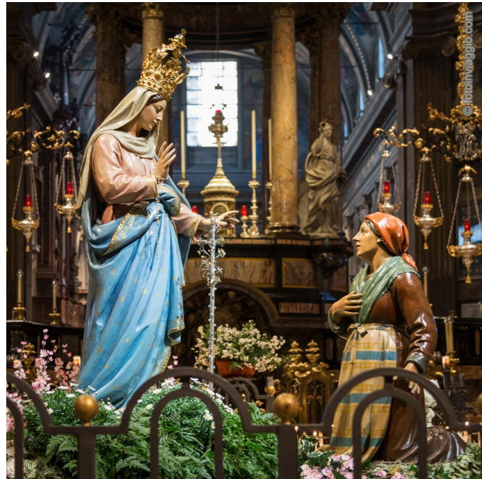
MADONNA DI CARAVAGGIO 26 MAGGIO 1432