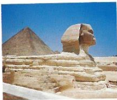
Piramide e Sfinge, simboli dello splendore egizio.

L'episodio è narrato nei capitoli 42-47 della Genesi: dopo essere stato venduto dai fratelli per invidia (e ritenuto morto dal padre Giacobbe), Giuseppe si ritrova in Egitto dove acquista potere fino a diventare vizir del faraone; in occasione di una grave carestia, i figli di Giacobbe sono costretti a scendere dal faraone per acquistare grano. Qui si ritrovano con sorpresa a tu per tu con il fratello incaricato proprio della distribuzione del grano. Giuseppe invita così Giacobbe e l'intera famiglia in Egitto mentre il faraone mette a disposizione la terra di Gosen (Gen 47,5-6), chiamata anche «terra di Ramses» (47,11), proprio in riferimento al faraone Ramses II.