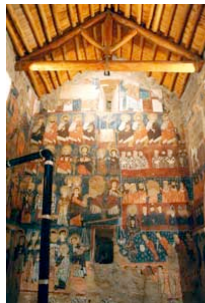
Una delle pareti affrescate della chiesa del monastero di Mar Musa, con la rappresentazione del Giudizio universale (XI secolo)