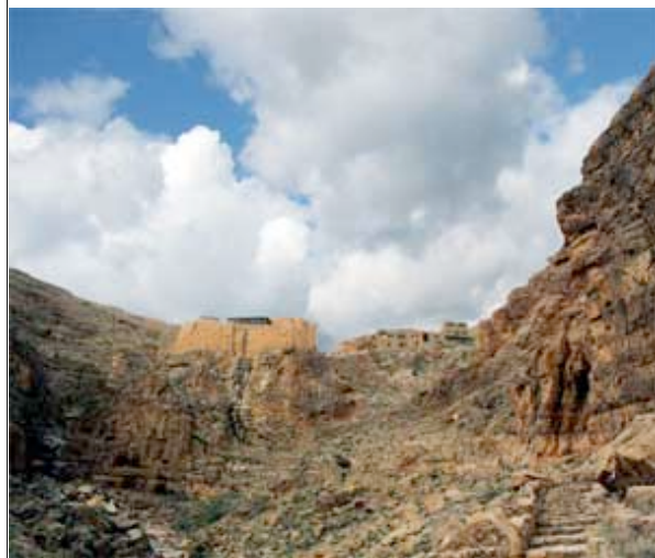
Il monastero di Mar Musa visto dal deserto sottostante

Il sentiero a lastroni rosa che si inerpicava su per la gola rocciosa assomiglia alla cicatrice di un'immensa ferita. Una specie di esile sutura rimarginatasi zigzagando per dribblare strapiombi e infidi ghiaioni nel corpo aspro di una delle montagne del Jabal al-Qalamoun, tra Damasco e Aleppo. Lì sotto, il deserto da dove sale il vento tiepido di primavera si distende verso l'Iraq impazzito di bombe e terrore. Lassù in alto, invece, la luce radente della sera rende ancor più inarrivabile lo skyline scabroso del monastero di Mar Musa al-Habashi, San Mosè l'Abissino. I bastioni millenari affacciati sul dirupo, lì dove già una vecchia torre romana vegliava a sentinella dell'ostile limes persiano, ancora oggi danno l'impressione della cittadella inaccessibile ai briganti, della fortezza issata sul baratro da chi voleva vivere al riparo dalle tempeste della storia. Ma basta camminare in salita una mezz'ora, arrivare in cima, per accorgersi che si tratta di tutt'altro. La porta del monastero è ancora bassa, così che per entrare bisogna piegarsi, ma almeno adesso è sempre aperta.