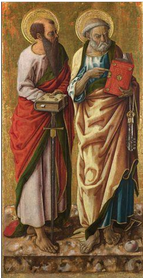
Carlo Crivelli, Santi Pietro e Paolo, Londra, National Gallery

per tre volte rinnega pubblicamente Cristo, abbandonandolo di fatto al suo destino. Eppure, paradossalmente, proprio questo episodio gli consente di sperimentare, forse più di chiunque altro, l'abbraccio della misericordia. « Simone di Giovanni, mi ami tu più di costoro? », gli domanda per tre volte il Risorto, rinnovando poi subito la chiamata a guidare il gregge dei fedeli «Pasci le mie pecorelle». Una chiamata cui, dopo la Pentecoste, l'apostolo consacra la vita, diventando un riferimento per i Cristiani a Gerusalemme, in Palestina, ad Antiochia, e operando miracoli nel nome di Gesù. Fin qui le fonti bibliche: il resto è tradizione. Varie testimonianze raccontano di un trasferimento a Roma. Nel cuore dell'impero il discepolo vive per alcuni anni, predica e coordina la comunità. Muore martire sotto Nerone, probabilmente intorno al 67 d.C.