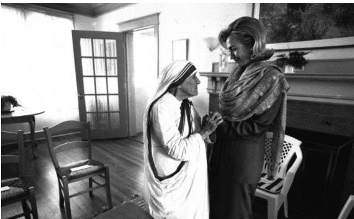
Hillary Clinton, allora first lady degli Stati Uniti, riceve Madre Teresa alla Casa Bianca.

I viaggi non si limitavano agli incontri con i vip: nel 1982, durante l'assedio di Beirut, in Libano, costrinse israeliani e palestinesi a un cessate-il-fuoco che salvò la vita ai piccoli pazienti di un ospedale in prima linea. E, ancora, prestò la sua opera dopo lo scoppio della centrale nucleare di Chernobyl (Urss), nell'Etiopia affamata dalla carestia e tra i terremotati dell'Armenia.