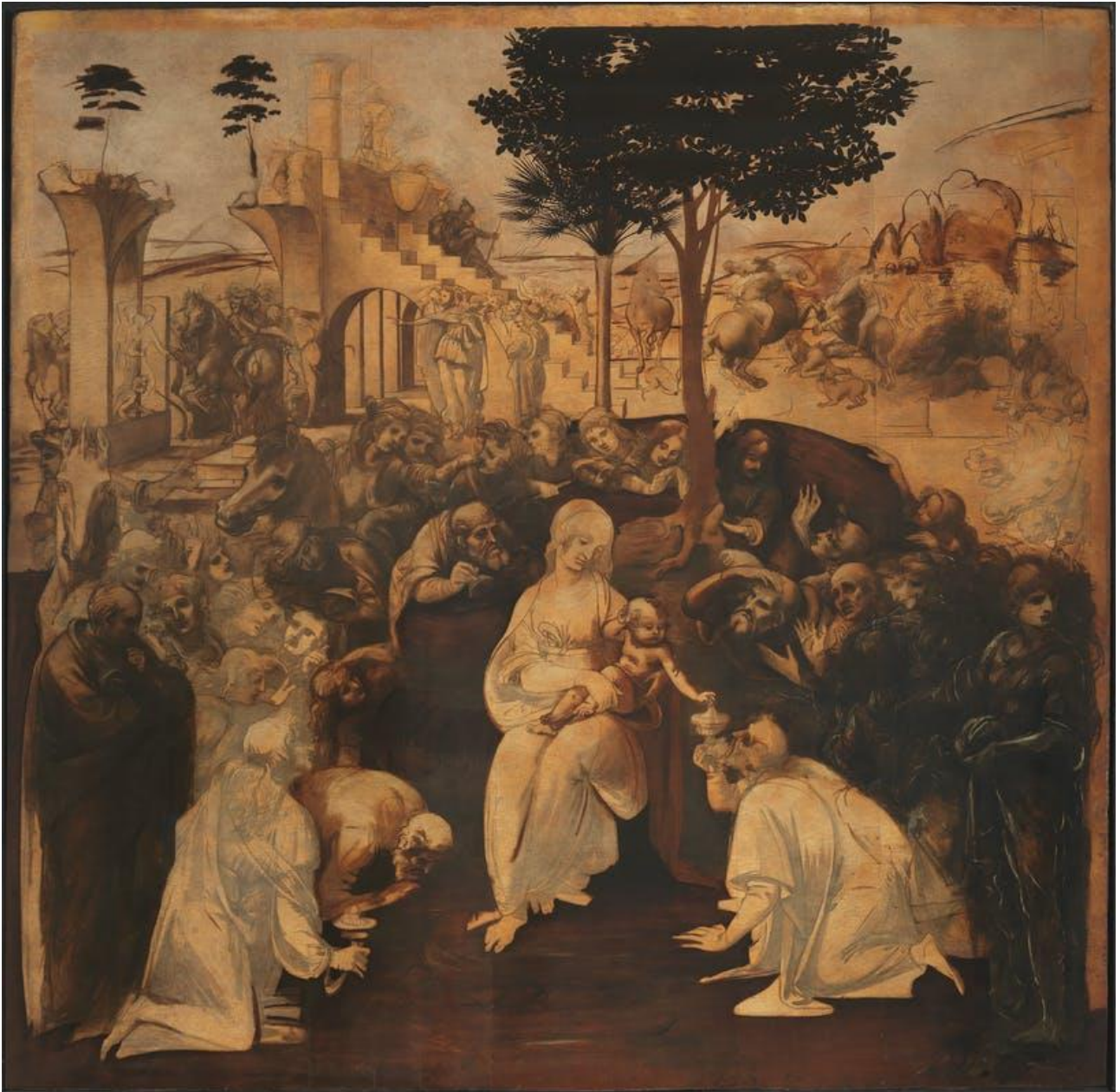
Adorazione dei magi (1482 circa) (Museo degli Uffizi) di Leonardo da Vinci (1452 –1519) Disegno a carbone, acquerello di inchiostro e olio su tavola Dimensioni 244 x 240 cm

Ma il fatto che Matteo non dia loro dei nomi è significativo. Potrebbero essere dei re, ma in questa storia sono semplicemente degli attori di supporto. Seguono la vera stella, il re dei re. Solo il suo nome è importante. L'Epifania non riguarda i Magi, riguarda Gesù.