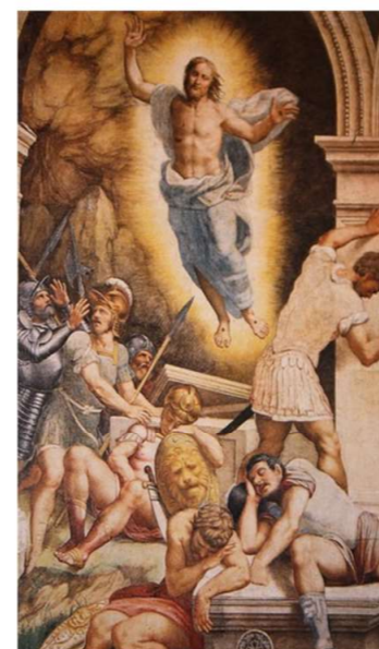
Resurrezione - Duomo di Cremona

AUGURI dal Consiglio Pastorale e dal Consiglio Economico