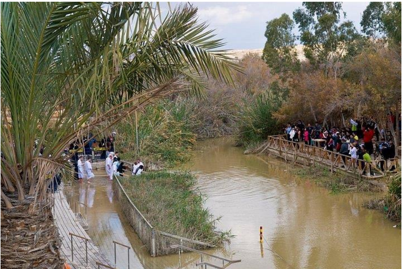
Il luogo nel quale la tradizione ha fissato il battesimo di Gesù è oggi meta di pellegrini sulle due sponde (quella giordana a destra nella foto) e quella israeliana.