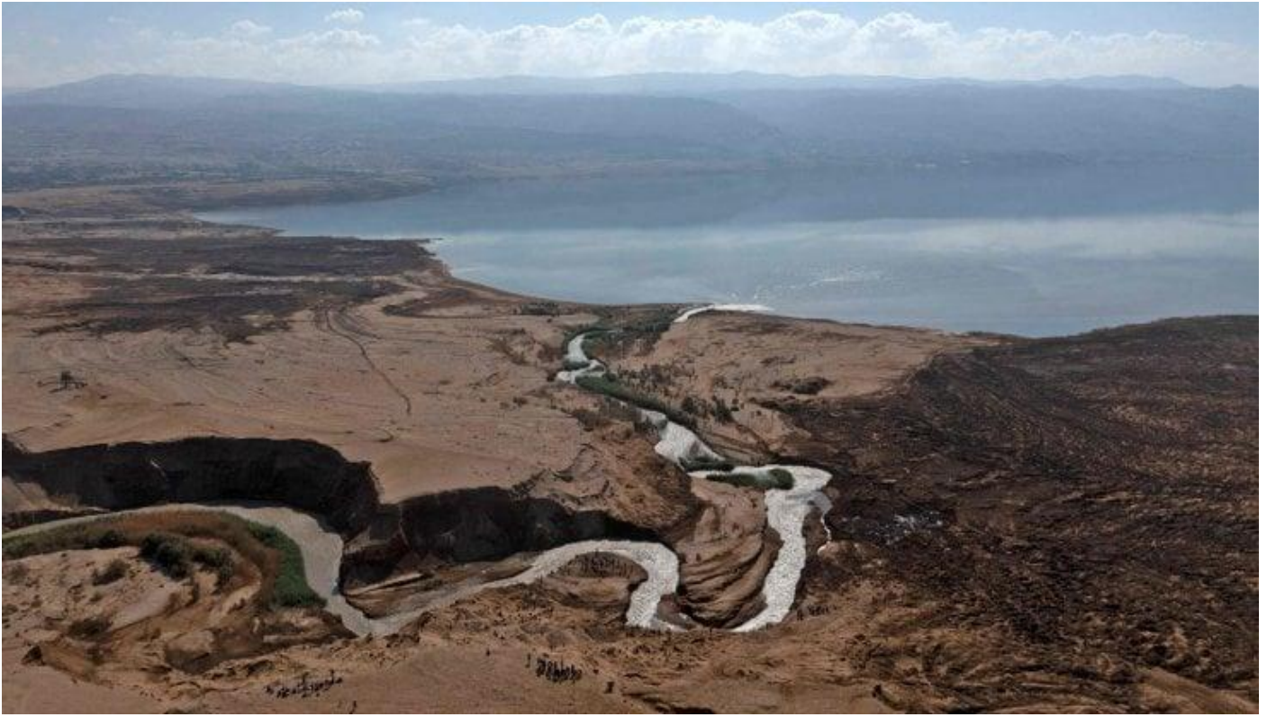
Il fiume Giordano in prossimità del Mar Morto: sulla sponda sinistra la Giordania (dove Giovanni predica e battezza); sulla destra Israele.