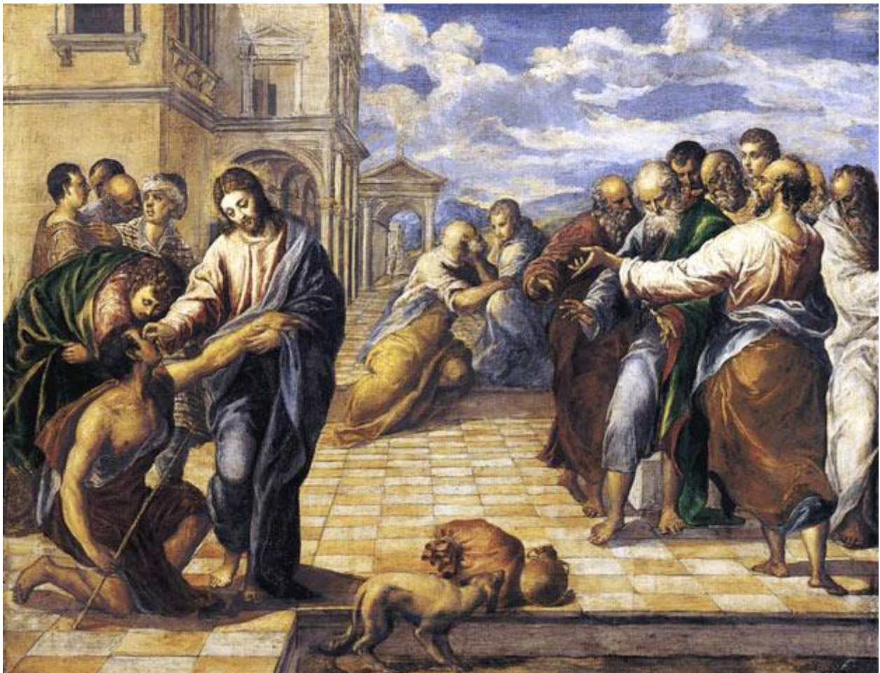
El Greco, Il cieco nato, 1567, Gemäldegalerie, Dresda